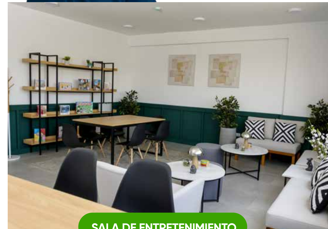
SALA DE ENTRETENIMIENTO