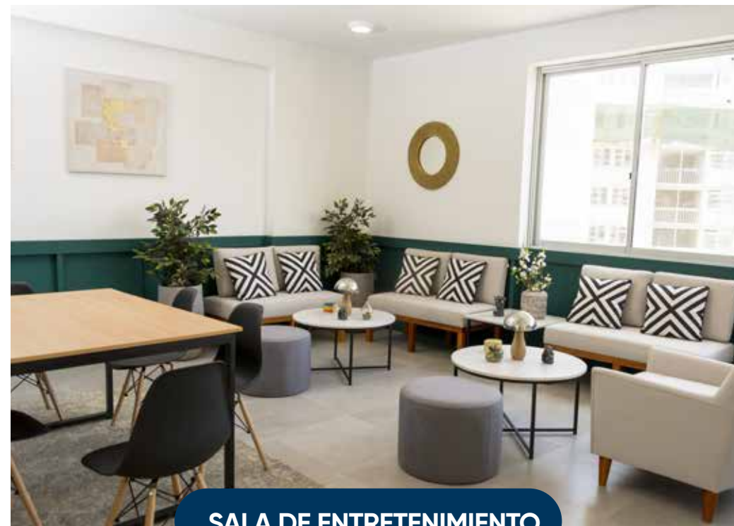
SALA DE ENTRETENIMIENTO