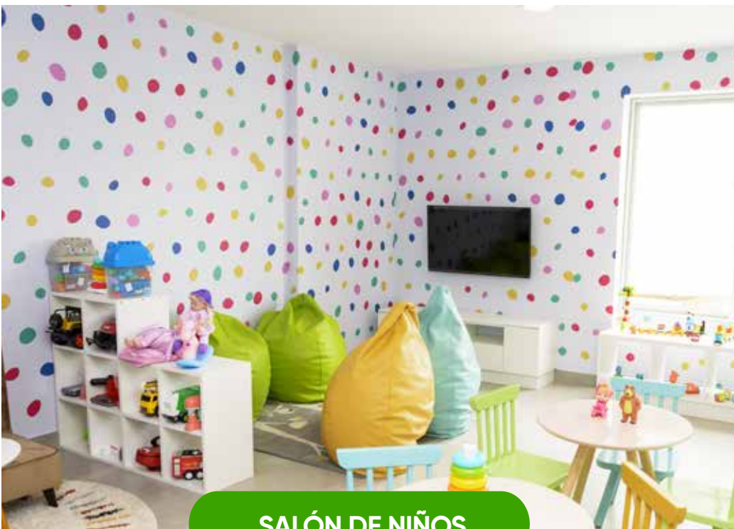
SALÓN DE NIÑOS