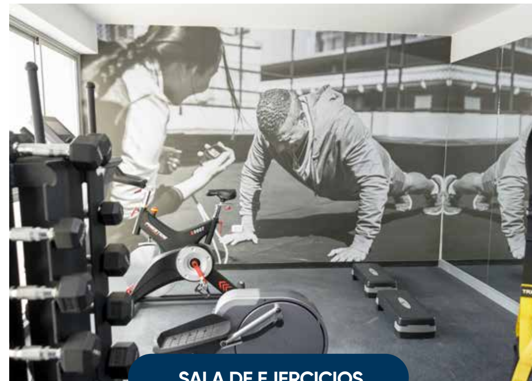
SALA DE EJERCICIOS