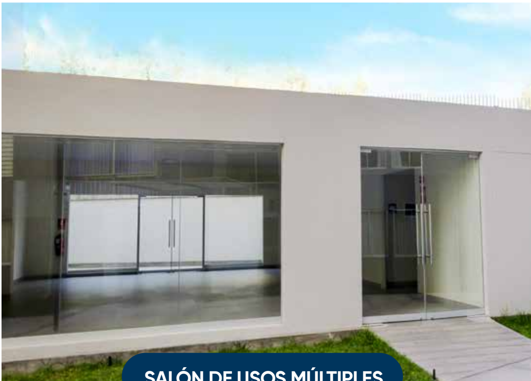
SALÓN DE USOS MÚLTIPLES